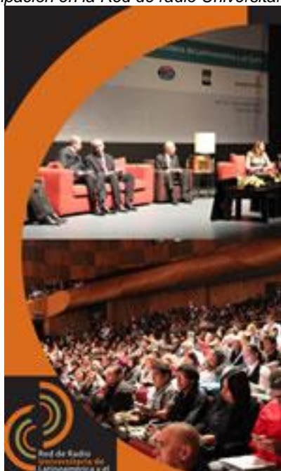
Participación en la Red de radio Universitaria Latinoamericana y del Caribe